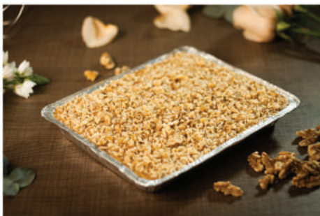
PAVÊ DE NOZES