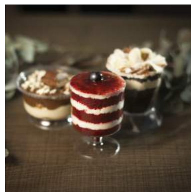
POTE RED VELVET