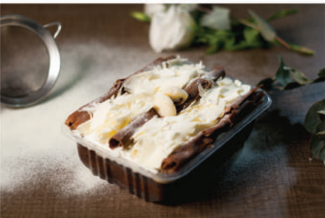
NINHO COM NUTELLA