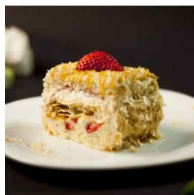
MIL FOLHAS DE MORANGO